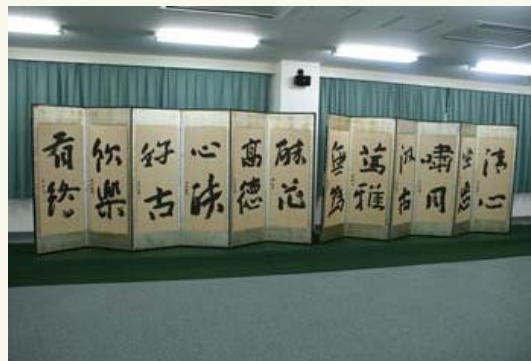
葉書のもとになった「六曲一双屏風」