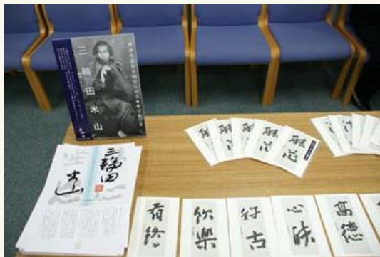
「六曲一双屏風」葉書

※三輪田米山は、1821年（文政4）年1月、伊予松山の日尾八幡神社神官・三輪田米山清敏の長男として生まれ、1908（明治41）年11月に88歳で没した伊予の神官です。28歳の時に父が亡くなってから家督を継ぎ、終生久米の一神官・書家として、その生涯を貫きました。